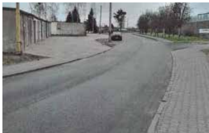
Ulica 15 Lutego