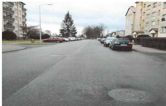
Ul. Wojska Polskiego