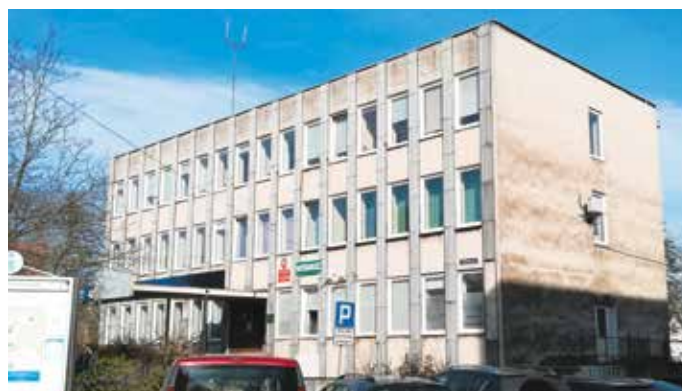
Budynek Urzędu Miejskiego